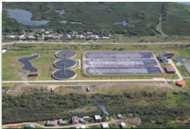
Planta de Tratamiento de Aguas Residuales "Tierra Negra"