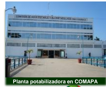
Planta potabilizadora en COMAPA