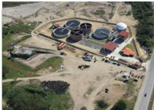
Planta de Tratamiento de Aguas Residuales "Morelos"